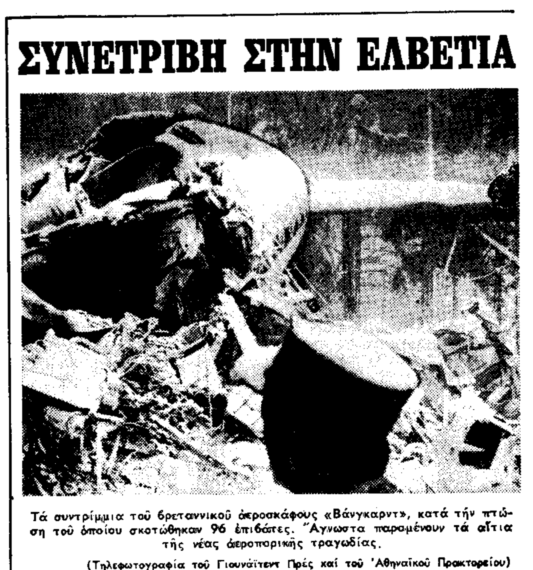
Τα συντρίμια του βρετανικού αεροσκάφους «Βάνγκορντ», κατά τη πτώση του οποίου σκοτώθηκαν 96 επιβάτες. Άγνωστο παραμένει το αίτιο της νέας αεροπορικής τραγωδίας.